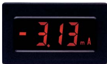
MDMV in Originalgröße

Das Voltmetermodul MDMV ist sowohl für den Einbau in eine Schalttafel, als auch für die Platinenmontage erhältlich. Durch einen automatischen Nullpunktgleich entfällt die manuelle Abgleichung des Nullpunktes. Der Eingangsbereich beträgt \pm 200 mVDC. Ein Über- bzw. Unterschreiten des Bereichs wird im Display angezeigt. Das MDMV verfügt über 5 Zusatzeinblendungen, die unabhängig voneinander eingeblendet werden können: BAT, V, A, m, \mu . Die hohe Genauigkeit, geringen Abmessungen und sehr einfache Installation machen das MDMV zu einer interessanten Alternative zu vielen herkömmlichen analogen Meßgeräten.