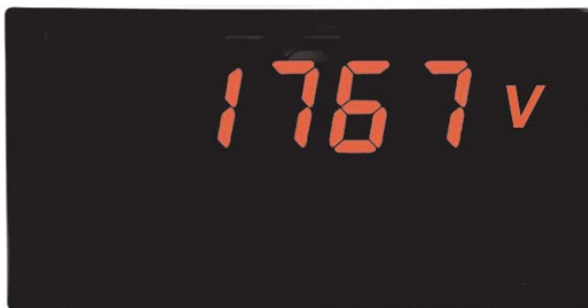
PAXLITE in Originalgröße

PAXLITE-Geräte werden im Maschinen- und Anlagenbau, in der chemischen Industrie, der Kunststoffindustrie, der Nahrungsmittelindustrie, der Verpackungs- und Fördertechnik und in vielen anderen Bereichen eingesetzt und helfen dort bei der Automatisierung und Vereinfachung von Arbeitsprozessen. Hohe Ströme bis 5 AAC können skaliert und in der gewünschten physikalischen Einheit angezeigt werden.