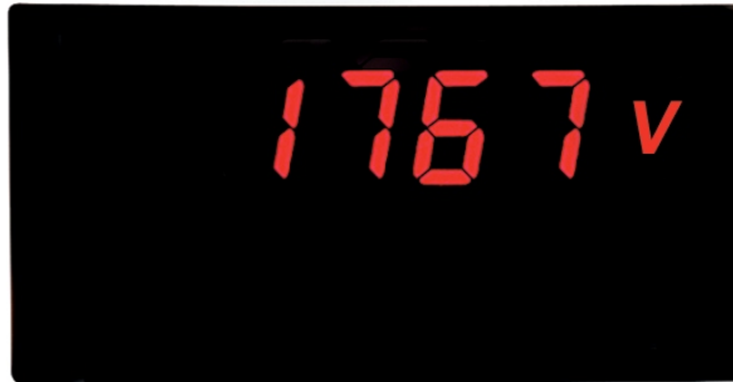
PAXLITE in Originalgröße

PAXLITE-Geräte werden im Maschinen- und Anlagenbau, in der chemischen Industrie, der Kunststoffindustrie, der Nahrungsmittelindustrie, der Verpackungs- und Fördertechnik und in vielen anderen Bereichen eingesetzt und helfen dort bei der Automatisierung und Vereinfachung von Arbeitsprozessen. Hohe Spannungen bis 600 VAC können skaliert und in der gewünschten physikalischen Einheit angezeigt werden.