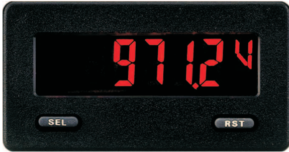
CUB51B00 in Originalgröße

Der CUB51 ist eine preiswerte Digitalanzeige für Gleichstrom. Er wird über die beiden Fronttasten einfach programmiert und wurde für den rauen Industriebetrieb entwickelt. Die Anzeige ist als Standard-LCD oder rot/grün hintergrundbeleuchtet lieferbar. Durch die freie Skalierung, den Minimal- und Maximalwertspeicher, die konfigurierbare Einheit und die optionale Aufrüstung mit bis zu 2 Schaltausgängen und serieller Schnittstelle besitzt der CUB51 ein sehr gutes Preis-/Leistungsverhältnis.